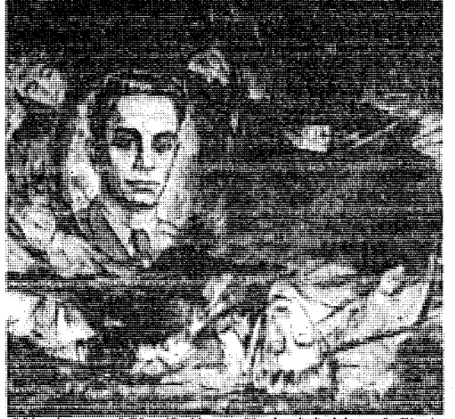
Πορτρέτο της μακαρίτισσας Φωτάκης, έργο του Ρέγκου, έκθεσής του σκό Βελλίδειο.

έκφραστικά χρώματα και δίνει πιο έντυπιακές άπεικονίσεις, ένά παράλληλα μεγαλώνει τις διαστάσεις των πινάκων του. Καί η άναζήτηση, ή έκτίναξη της τέχνης του Ρέγκου είναι συνεχής, άν και με ρυθμό όχι ταχύ. Ένα έργο πλούσιο, με σχεδιαστική όδύτητα, με συνθετική άριότητα και με έσωτερική ήρεμια είναι τό Πορτρέτο της μακαρίτισσας Φωτάκης ή Πορτρέτο της Μακαρίτισσας Φωτάκης .