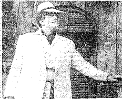
Ο Άλμπερτ Φινέι, όπως εμφανίζεται σκό ρόλο του πρόξενου, σκό φίλμ «Κάτω από τό ήφαιστέιο»