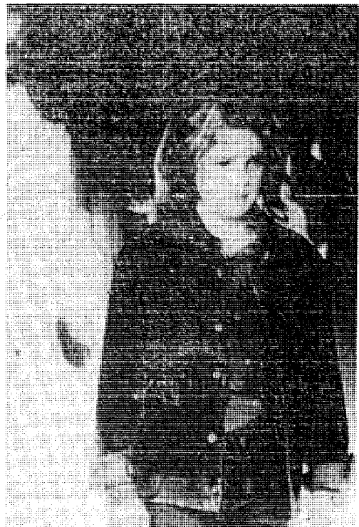
Η Νεριού Μπάρρορ, ένα παρελκίδι της μεγάλης οικογένειας, τών ήθοποιων, νού εκκλήσει στο φιλμ «Εμπρήστρια»