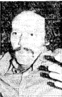
Ο σκηνοθέτης Πάνος Παπαϊωάννου πού συνομιλεί με τόν «Οίκο Εύγηρίας»

τό ελληνικό έργο δέν διατάζουν νά χυδαιολογήσουν, νά μιλούν τήν άρχική, χωρίς ταμπού, ή νά υψώνουν τή γροθιά τους.