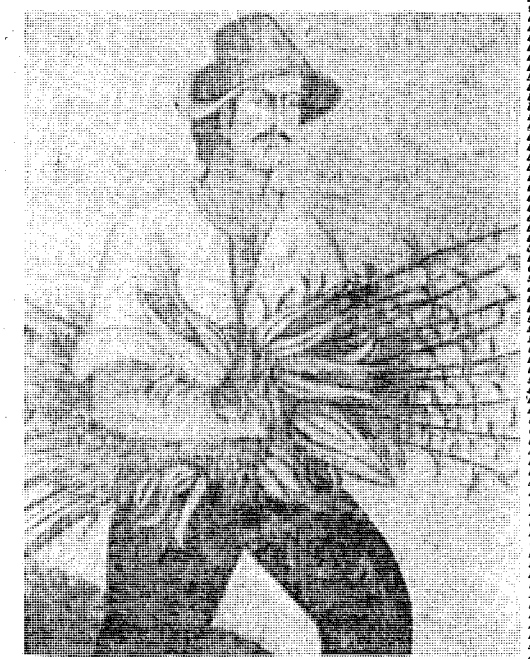
Ένας από τούς πίνακες τού Κοσυιουτζή, από τήν ζωή και τό μόχθο τού Μακεδόνα άγρότη

Και δέν, τελευταίως ένώ. Είναι γνωστό πόσος όνάμος έγώ νά περιληφθεί στην διάρθρωση τής σχολής ένα τμήμα πού θά θρύνει δασκάλους τεχνικών μαθημάτων γιά τή στοιχειώδη και μέση εκπαίδευση. Ο τ.