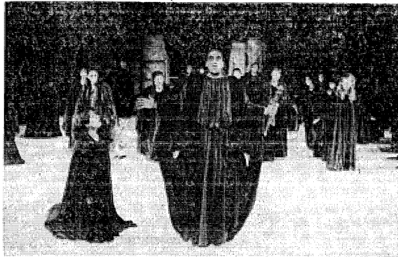
Μία σκηνή από τήν τραγωδία «Ικέτιδες» πού θα παρουσιάσει τό ΚΘΒΕ στό Ηράδειο.

Νά ξαναθυμίσουμε όσα έχουμε γράψει και παλιότερα για τήν ανά-