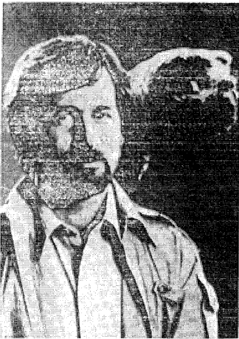
Ο Στήβεν Σπιλμπεργκ και το δημιούργημά του, ο «Εξωγήινος».