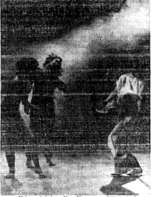
Επίσημη φωτογραφία από μια παράσταση της Τρια Μπράουν.

γράφει της Μπράουν φοριέται στούς χορευτές σαν σκαυλισμαμένο ρούχο, μόνο που τó ρούχο αυτό έχει σχεδιαστεί από δεξιότερη ράφτη. Οι χοροί δεν νοιάζονται για κοινωνικά θέματα, ούτε σε ανθρώπινες συγκινήσεις, αλλά διερευνούν τής δυνατότητες που άναρωτησαν πέρφως»