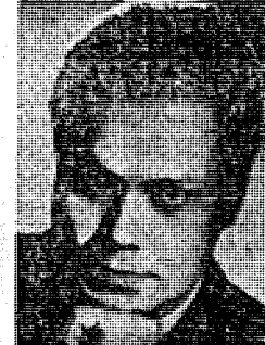
Ο βαρύτονος Φίσερ - Ντισκόου που ή συμμετοχή του στό έφετινό φεστιβάλ του Σάλτσμπουργκ είναι σημαντική

Την συμφωνική της Βιέννης θα διεθυνθεί έπισης και ο Λόρν