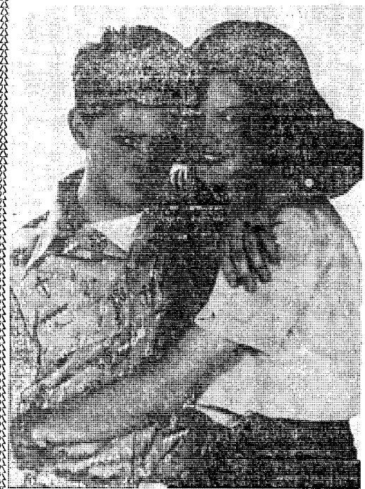
Η Ελίζαμπεθ Μάκ Γκόδερν και ο Σήν Πέν οι δύο πρωταγωνιστές του φιλμ «Κωνητώντας το φεγγάρι».