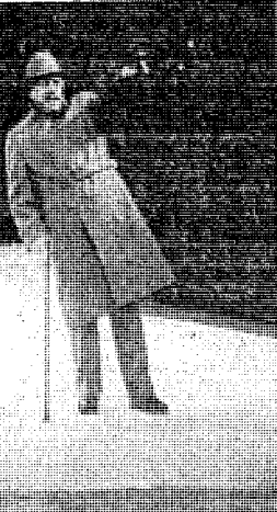
Μία σκηνή από τήν λονδρική παράσταση τού έργου τού Μπρέντον «Η ίδιοφούα».

...δίκως τού δέν μπορεί νά διαβεί σκηνοθεσία, άκόμη και τά δικά τους ποιήματα. Άλλωστε κάποια πρωτόλεια τού Ρίλκε άνάγονται σέ κείνη τήν έριολική (όπως τήν περιγράφει ό ίδιος) εποχή. Αυτή είναι ή άντικειμενική άλθηθεια, σίτσάσο έκείνο πού μετράει είναι ή υποκειμενική αίσθηση πού εχει ό ποιητής. Ο ίδιος έγραψε τόν 1894 πώς γίνονταν άγριες θανατώσεις, «σά άνια τών άγιων τής ψυχής τών παιδιού», μία έκφραση χαρακτηριστική τής θρησκευτικής στάσεως τού έφήσου.