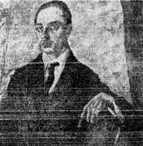
Πορτραῖτο τοῦ ποιητῆ φιλοτεχνημένο ἀπὸ τὴν Λουὶ Ἀλμερτ - Λαζάρ.

Χωρὶς ἀμφιβολία τὰ χρόνια στὸ πανεπιστήμιο τοῦ Λίντς καὶ τῆς Πράγας ὑπῆρξαν τὰ πῶ φωτεινὰ στὴν ζωὴ τοῦ ποιητῆ, μὴ καὶ δὲν ἦταν ἀφιερωμένα μόνον στὴν ἐπιστήμη. Ὁ ἴδιος τὰ χαρακτηρίζει σὰν χρόνια ἔξουσιασῆς καὶ ρεμπλιού, χρόνια ἀναζητήσων καὶ ἐρωτῶν, χρόνια δσομῶν στὴν λογοτεχνία, ὀπου ὄλο καὶ περισσο-