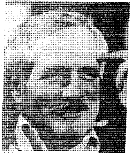
Ὁ διάσημος στάρ πού δοκιμάζει τὴς δυνάμεις του στὴ σκηνοθεσία

Ὁτὸσο ὁ Ρίλκε δὲν ἀσχολεῖται μόνον μὲ τὴν ποίηση. ἔχει γράψει καὶ πεζὰ πού τὸ πῶ ὀνομαστὸ τους εἶναι τὰ «Τετράδια τοῦ Μάλτε Λαούρις Μπρίγκε», ἓνα λεπταῖο βιβλίο πού ἔχει μεταφραστῆ ἐπὶ ἑλληνικὰ ἀπὸ τὸν κ. Δήμου καὶ ἔχει μάλιστα πρωτοσυκκοφορῆσθι στὴν Θεσσαλονικίη (ἀπὸ τῆς ἐκδόσεως τοῦ βιβλιοπωλείου τοῦ ἀξῆχαστου Σωρῶπουλου), ὀπως ἔχουν μεταφραστῆ στὴ γλώσσα μας καὶ πᾶθος ἀπὸ τὴν ποιητικὴν ἔννοια τῆς λέξεως, ὁ Κάμινγκς