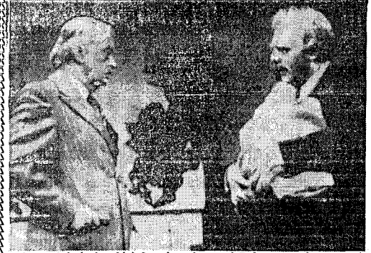
Μία σκηνὴ ἀπὸ τὸ πὸν ἐνδιαφέρον ἔργο τοῦ Γεωργίου Τρακαφῶ στὸ «Πάρκο», πὸν δίγει ἐνδιαφέροντα προβλήματα τῆς σύγχρονης ζωῆς.

—Πότε πρωτοποιήσατε στὸν ἑλ- Ο κινηματογράφος με ἔζησε. Ἐπαιξά