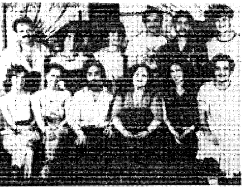
Η παραστάση και η ομάδα της «Φαίδρας» στο Εθνικό Θέατρο

— Επιτελούν τις προθέσεις τους, αλλά νομίζω ότι μένουν στις προθέσεις. Για τό μιλήσαμε για καλές παραστάσεις στην τραγωδία θα έπρεπε να μπορούμε να πουμε ότι κάνουμε καλές παραστάσεις σ' άποιαδήποτε έργα. Η τραγωδία είναι ή «ελάττωμα» να είναι ένας μεγεθυντικός καθρέφτης μέσα στον οποίο θέλουμε να δούμε τό πρόσωπο μας ή την ψυχή μας. Ετσι κάθε μειονεκτμία του προσώπου ή της ψυχής εκεί πολλαπλασιάζεται. Η τραγωδία είναι ένα τραγούδι να τραγουδιέσαι χωρίς μικρόφωνο. Είναι τό άκόν που δοκιμάζονται τό μέταλλα. Είναι ο εξομολογητής που δεν μπορεί να του πες ψέματα. Χρειάζεται όχι μεγάλους υποκριτές, χρειάζεται σεμνούς, ασκητικούς και άσκημένους καλλιτέχνες. Ηθοποιός μιά φορά άποδοση όλο είναι ή τραγωδία. Τό ίδιο και ο σκηνοθέτης και όποιος άλλος άσχερατί με τό στήμα ενός τέτοιου έργου. Πιστεύω ότι αν πάει κανείς μιά έπισκεπή στο θέατρο της Επιδάουρου και μείνει για λίγο μέσα σ' αυτό τό χώρο, μπορεί να ανακαλύψει ίσως, όχι να γνωρίσει, αυτές τις ύπέριτες ισορροπίες που έχει και ή τραγωδία. Εγω μιά φορά άσχελλήθηκα με τραγωδία, περισσότερο για να αναγκαστώ να καταθέσω τα όπλα της έμπειρίας και να πω φράσεις για να νιώσω τη ρίζα αυτών των λόγων, δηλαδή να νιώσω την ανάγκη να