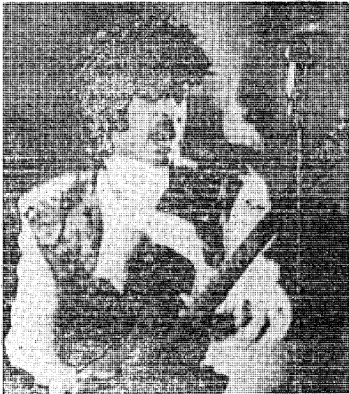
Ο πρωταγωνιστής Πρίνς της «Πριγκίπισσας», όπως εμφανίζεται στην κριτική ταινία, που προηγήνεται επιτυχώς.