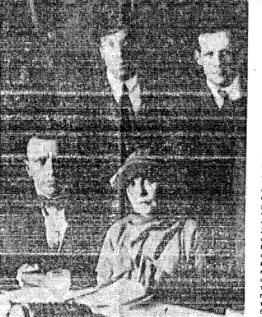
Ο Μπόρις Πάστερννακ, ὄρθος σὴ μέση, με δισωμῆτες, φίλους του: Δίπλα του ὁ σκηνοθέτης Αἰζενστάιν και καθισμένοι ὁ Μαγιακόφσκου και ἡ φίλη του Λίβ Μπρίκ.

Ο Πάστερννακ κί ὁ ἕαυτός του Γιά νὰ καταλάβει κανεὶς τὸν χαρα-