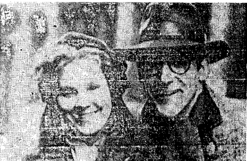
Μιά σκηνή από τό έργο τού Λιούμει «Ντάνιελ».

κινήματα (συμβολισμό, ρο- σκέφτηκε τήν πατρίδα δύο φορές,