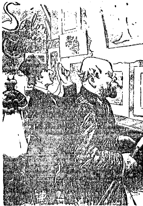
Ο Μωρεάς και ο Βερλαίν ήταν σκενοί φίλοι. Στο σχέδιο, οι δύο ποιητές σε μιά έκθεση τό 1896.

Μολονότι σκόπημα έχασε μιά γιά πάντα τήν προηγούμενη λογοτεχνική παραγωγή του, αυτή που είχε στα χρόνια που έμενε στην Ελλάδα, επι-