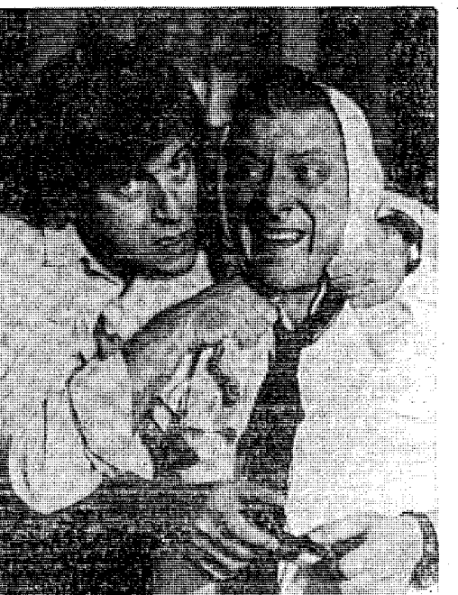
Κώστας Βουτσάς και Κώστας Καρράς: συνένωση δυνάμεων σὸν ἑλλάδα νῦν.

Νομίζω λιγότερα ἀπὸ ἕνα νέο ἠθοιοῦ. — Καὶ ὁ Κώστας Καρράς συνεχίζει πᾶνω σὸ ἴδιο θέμα μετὸ εἰλικρίνεια και σαθαρότητα: — Οἱ παράλογες ἀπατήσεις θὰ δημιουργήσουν προβλήματα και στοὺς νέους, ἀλλὰ και στοὺς πολυτέρους ἠθοιοῦν. Στοὺς νέους θὰ δημιουργηθεῖ ἀνεργία. Στοὺς παλιότερους δυσκολίες σὸν τὸ κάνουν μεγαλύτερους θισσους και ν' ἀνεβᾶ-