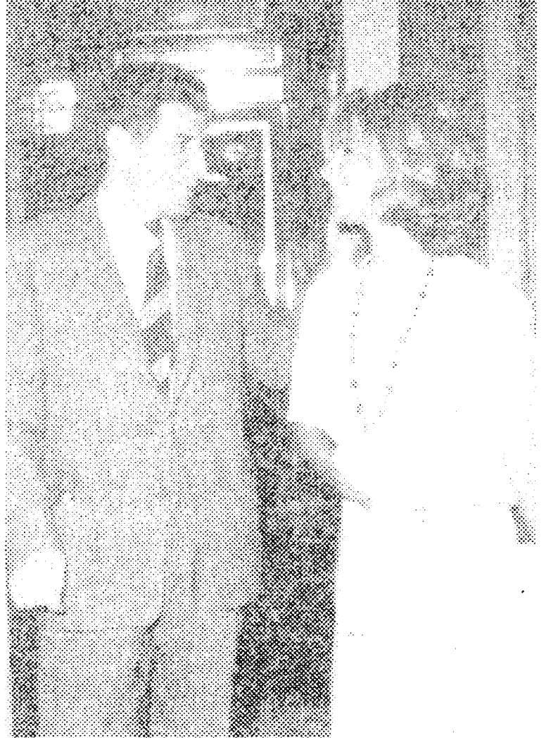
Με την Αλίκη Βουγιουκλάκη (1960), στο Α΄ Φεστιβάλ Κινηματογράφου

- Το 1987 κυκλοφορεί το μεγάλο μυθιστόρημα του "Η Μεγάλη Πλατεία" με υπότιτλο: "Ιστορία των Μέσων και Νέων Χρόνων" που είναι το πιο πολυσέλιδο ελλην. μυθιστόρημα με 553 σελίδες. Στο βιβλίο γίνεται μια σύνθεση συμβάντων και προσώπων της Θεσ/νίκης μέσα από την ιστορία τεσσάρων βασικών προσώπων και της γενιάς που μεγάλωσε μέσα στην κατοχή και στον εμφύλιο σε μια έξοχη τοιχογραφία που εκτείνεται χρονικά σε μια περίοδο από το Μεσοπόλεμο, την Κατοχή την Αντίσταση, την Απελευθέρωση και τον Εμφύλιο. Παρεμβάλλονται ποιητικά ιντερμέντια για το κίνημα των Ζηλωτών του 1342-1349 στη Θεσ/νίκη.